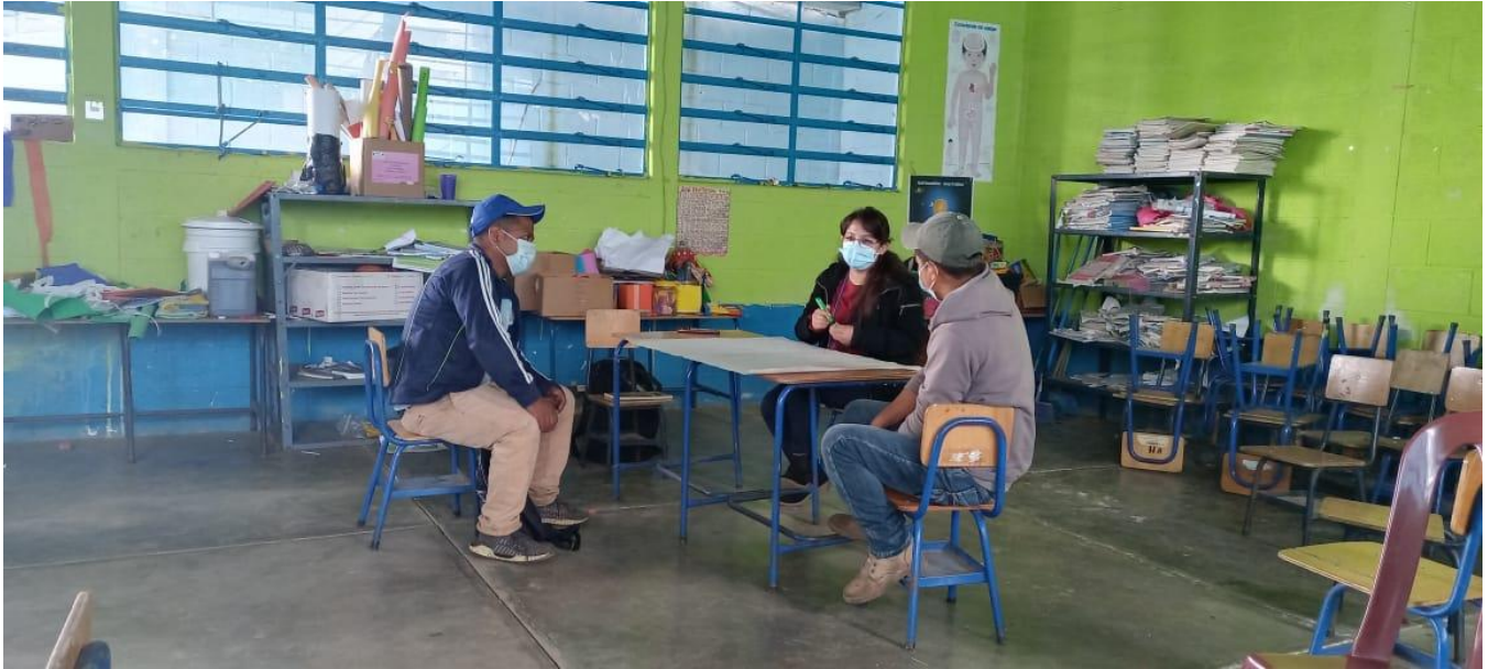
Fotos: Fotografía de reuniones de trabajo con COCODE.