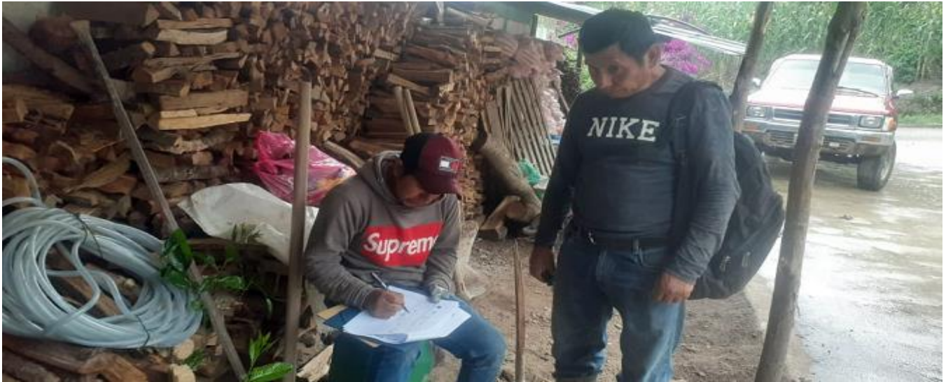
Fotos: Fotografía de reuniones de trabajo con comité de Agua.