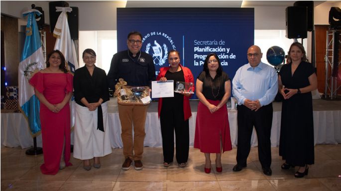
Acto de reconocimiento por antigüedad.

Logros: 1) Optimización del proceso de reclutamiento: reducción del tiempo promedio de contratación de 90 a 75 días (17% de mejora); 2) Finalización de 95 procesos de dotación de personal bajo en renglón 011 (14% de mejora); 3) 95 contrataciones por prestación de servicios técnicos/profesionales bajo el renglón 029 (incremento del 259%); 4) 144 contrataciones bajo el renglón 021 "Personal Supernumerario" (incremento del 26%) y, 5) 41 contrataciones por prestación de servicios técnico en el renglón del Sub 18.