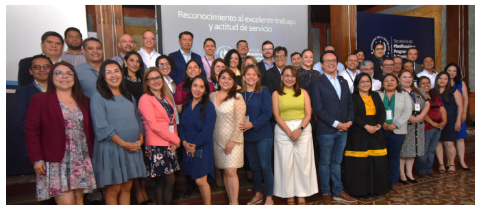
Reconocimiento por excelente trabajo.